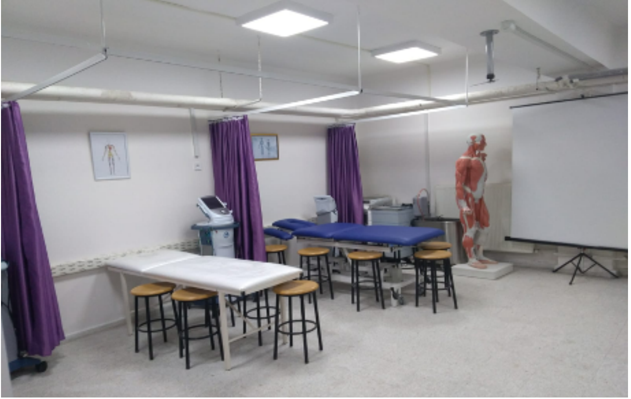
Elektro - Isı - Işık - Hidroterapi Eğitim Laboratuvarı