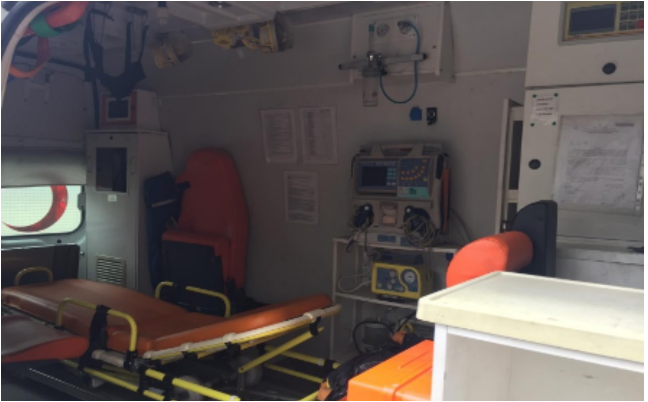
Eđitim Ambulansı İ Görünümü