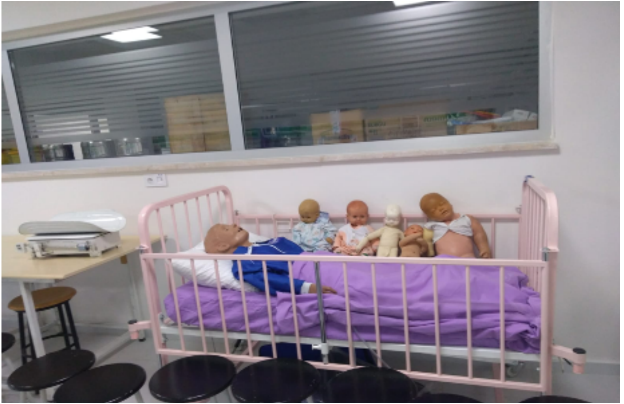
Drama ve Uygulama Laboratuvarı