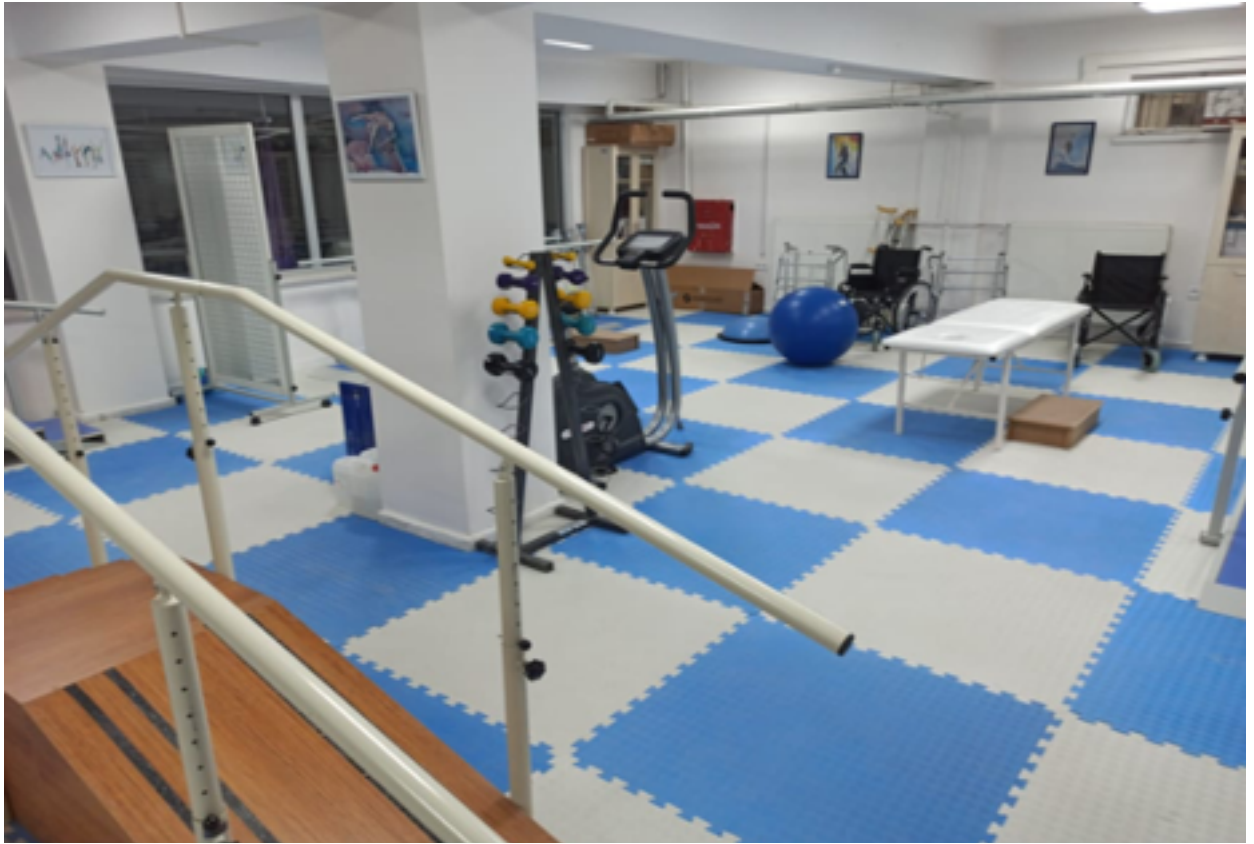
Fizyoterapi ve Rehabilitasyon Eğitim Laboratuvarı