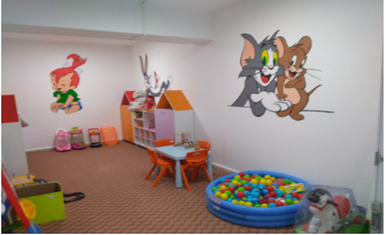
Çocuk Duyu Ünitesi