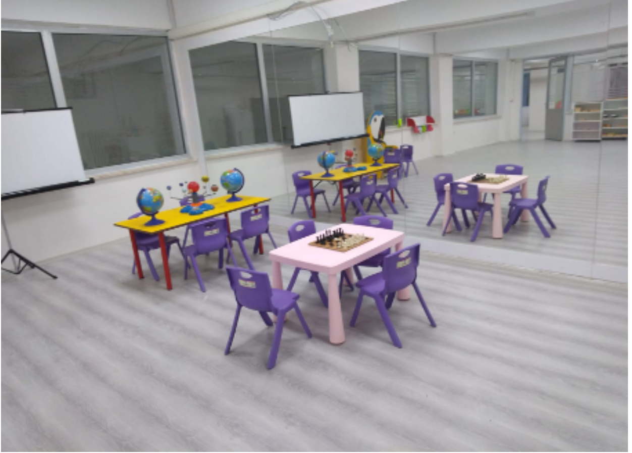
Çocuk Gelişimi Uygulama Ünitesi

Bu bölümde fakültemizde bulunan laboratuvarlar, uygulama üniteleri ve sınıflar hakkında görseller verilmiştir.