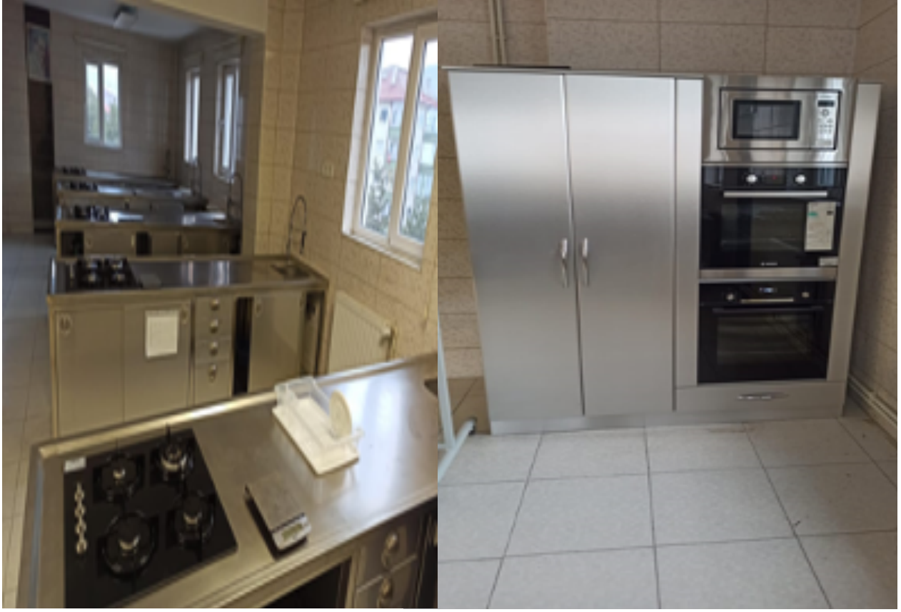
Beslenme ve Diyetetik Laboratuvarı