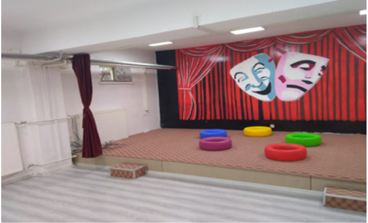
Drama ve Uygulama Laboratuvarı