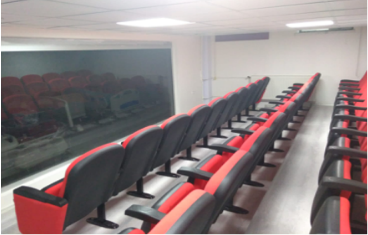
Simülasyon Laboratuvarı İzleme Salonu