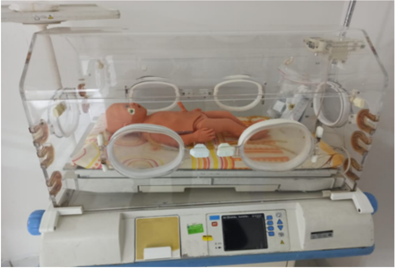
Yeni Doğan Ünitesi